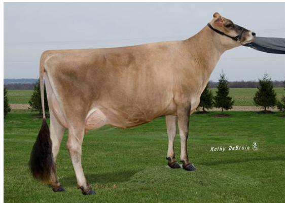
JX PINE-TREE AVON DELLA {3} DAM