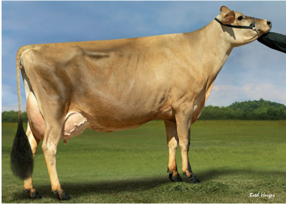
OAKLANE CHISEL DELLA 2130 GRANDDAM